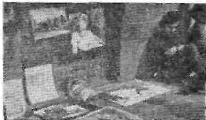
Художник на старом мосту во Флоренции.

Уютный дворик Бельведерский. Многочисленные мраморные ванны (древние римляне любили купаться). А вот и Аполлон. Да, да, тот самый, Бельведерский. Рука тянется к