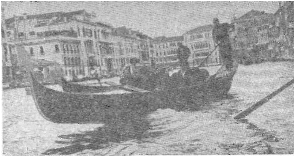
Советские туристы в Венеции.

Церкви и музеи при них — главные хранители бесчисленных произведений античных и средневековых мастеров. Многие века искусство в этой стране