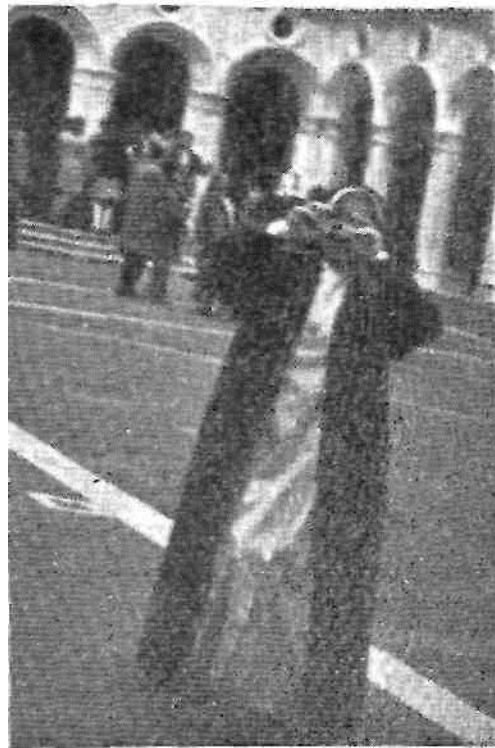
Снимочек на память.

Рафаэль... Четыре небольшие сводчатые комнаты, в которые трудно протиснуться — так здесьлюдно.