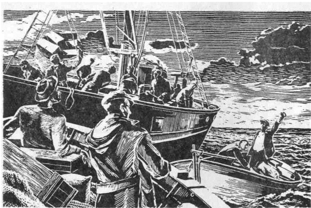
РИС. В. ГУКОВА.

никак не найдет проход между нашими сетями и японскими. Увидел, что я сержусь, и пошел звать на помощь Сергея Ивановича, а Сергей Иванович, вот бродяга, живо нашел и докладывает: