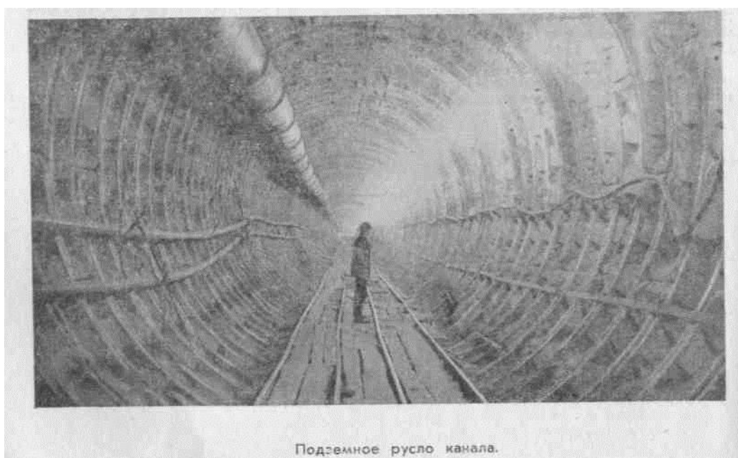
Подземное русло канала.

Часть канала будет проложена под землей. По подземному руслу, на глубине 170 метров, пройдет кубанская вода, чтобы потом выйти на поверхность шестью километрами дальше. Каждый новый метр канала, проложенный строителями в степи, приближает дни пуска канала.