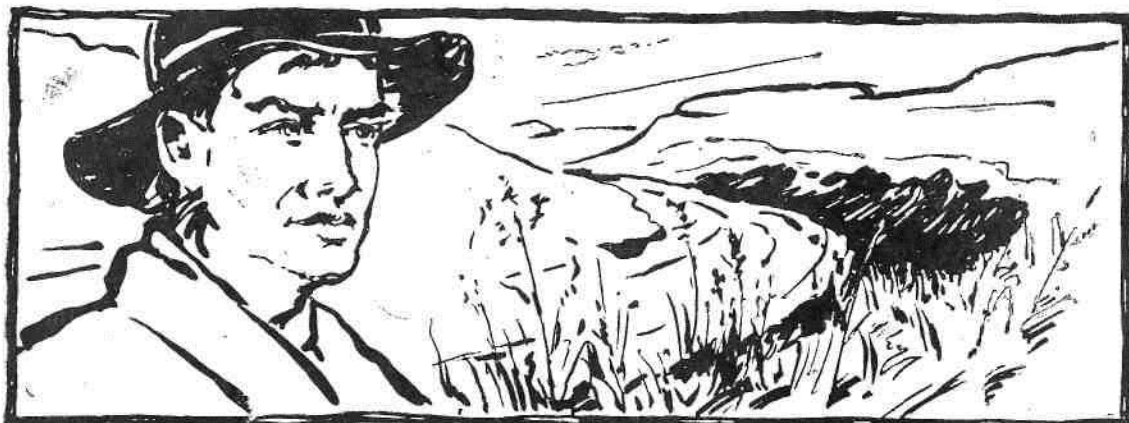
Прораб насосной станции А. М. Кармазов

первые слова положит он на белый лист бумаги